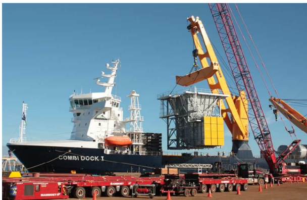
Ladungsteil „PAU 11104“. 23 m lang, 16 m breit, 21 m hoch, 316 t schwer.